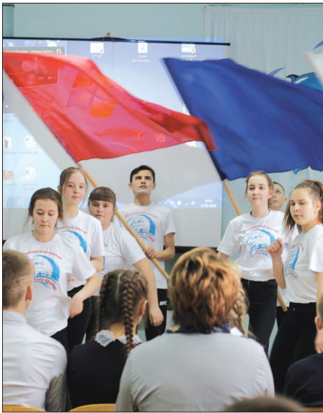
25 марта в Фоминской школе были подведены итоги социально-педагогического проекта «Будь здоров!».

Проект начал свою деятельность как «соревнование классов, свободных от курения». Изначально он был создан для школьников Екатеринбурга, но сразу вызвал большой интерес у учащихся из близлежащих городов, и проект получил областной статус. Ежегодно в нем принимают участие порядка семи тысяч подростков – учащихся с седьмого по девятые классы. Девиз проекта - «Здорово быть здоровым!». В 2018 году к проекту подключился и Ирбитский район, педагоги, подростки и их родители поддержали цели и задачи областного проекта. Старт был дан в октябре, в спортивном зале Гаевской школы, участвовали коллективы трех школ Ирбитского района - учащиеся седьмых классов Гаевской и Пьянковской школ и ученики восьмого класса Фоминской школы.